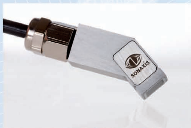
Sonde 64 éléments 2D