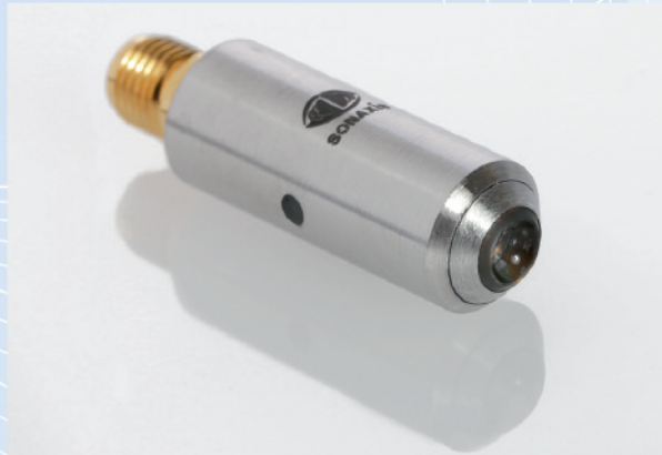
Sonde haute fréquence miniature